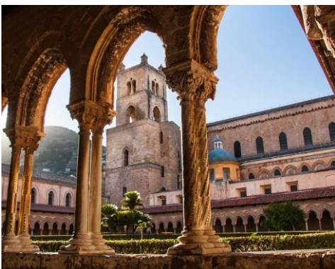
MONREALE DUOMO E CHIOSTRO

Dopo la prima colazione, Tempo libero per visite individuali. Pranzo. Nel tardo pomeriggio trasferimento in aeroporto e volo di rientro a Bologna. All'arrivo Fine dei Servizi.