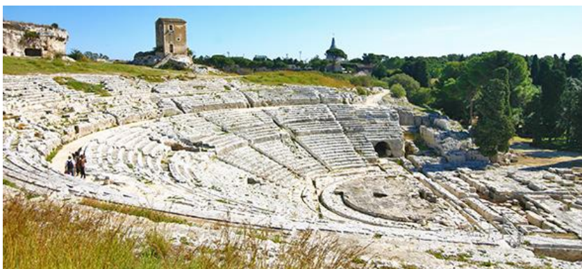
SIRACUSA TEATRO GRECO

Prima colazione in hotel. Giornata dedicata alla visita delle località limitrofe come Ragusa, Noto. Pranzo in ristorante. Successiva partenza per Acireale città storica e barocca, passando per Catania. Sistemazione in hotel, cena e pernottamento.