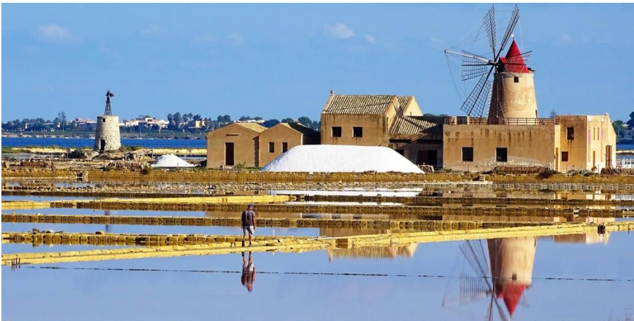
SALINE DI MOZIA

Prima colazione in hotel. Mattinata dedicata, attraverso la via del sale con i suoi mulini a vento, alla visita delle saline di Marsala e all'isola di Mozia. Pranzo in ristorante. Nel pomeriggio breve visita di Trapani e proseguimento per la zona di Agrigento. Sistemazione in hotel nelle camere riservate. Cena e pernottamento in hotel.