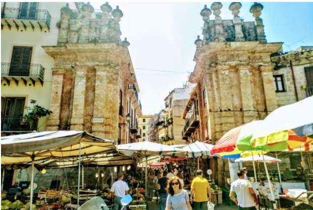
PALERMO-MERCATO DEL CAPO

Prima colazione in hotel. Intera giornata di visite della città e di Monreale. Pranzo in ristorante. Cena e pernottamento in hotel.