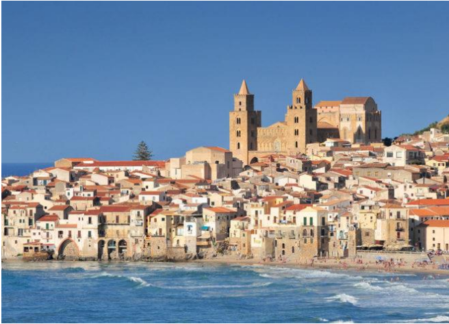
CEFALU' VISTA CATTEDRALE

Prima colazione in hotel. Partenza per Taormina per la visita della città famosa nel mondo, si prosegue poi per Cefalù per la visita della parte storica e il duomo. Pranzo in ristorante. Nel pomeriggio si prosegue per Palermo, sistemazione in hotel. Primo contatto con città. Cena e pernottamento.