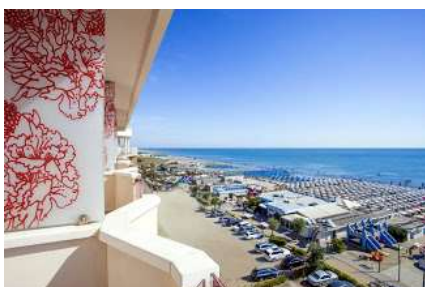
Veduta da Hotel

La location fronte mare e la vicinanza al vivace centro città rendono la permanenza in questo 4 stelle un piacere per tutti. Le famiglie apprezzeranno la vicinanza alla spiaggia e le attività di animazione per i bambini , i più grandi si divertiranno soprattutto la sera grazie alla movida romagnola! Vi accoglieremo con i sorrisi e il calore dei nostri esperti collaboratori. Le nostre camere, i nostri servizi e le nostre attenzioni saranno la cornice per le vostre vacanze al mare! La ricca cucina romagnola sarà ancora più buona se gustata sul ristorante panoramico vista mare. Accogliamo volentieri gli amici a 4 zampe nel nostro hotel, e non solo, anche in spiaggia presso il nostro Bagno è a disposizione un' area dedicata a loro .