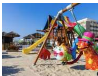
Giochi per Bambni